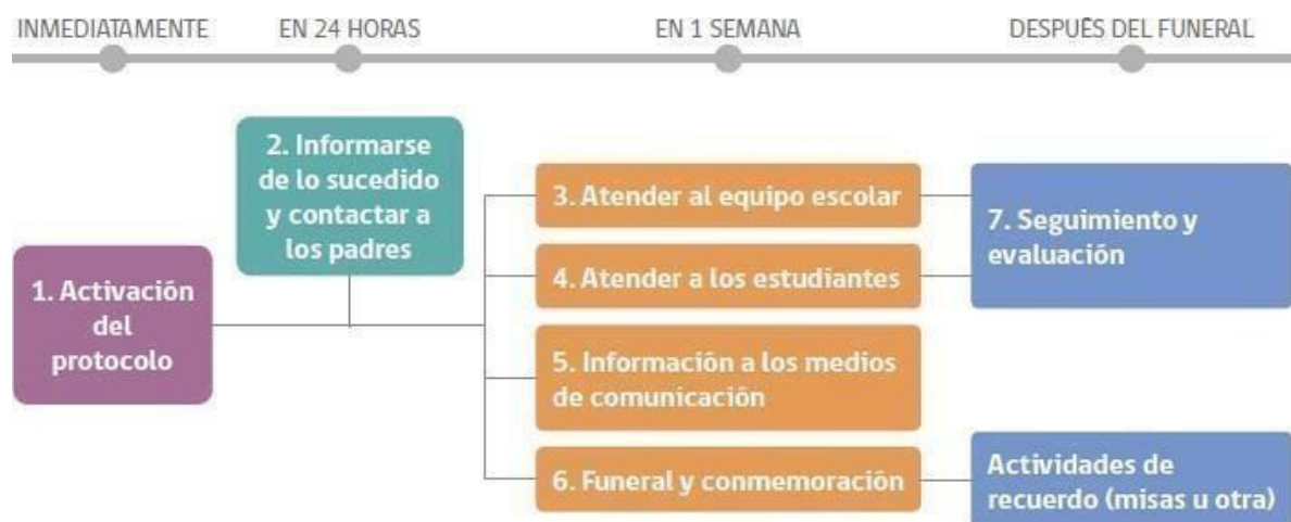
Diagrama de siete pasos que se deben seguir tras una muerte por suicidio de un o una estudiante: